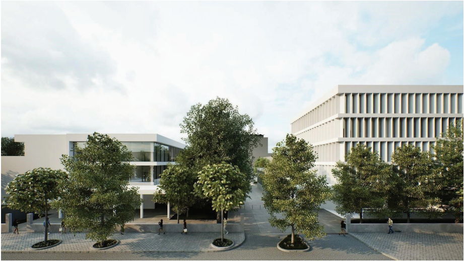
Нова општинска зграда