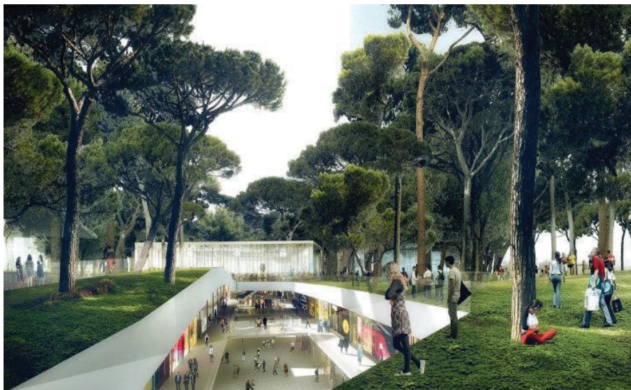
Нов Зелен Пазар