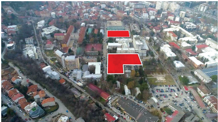
Катни гаражи во Клинички Центар