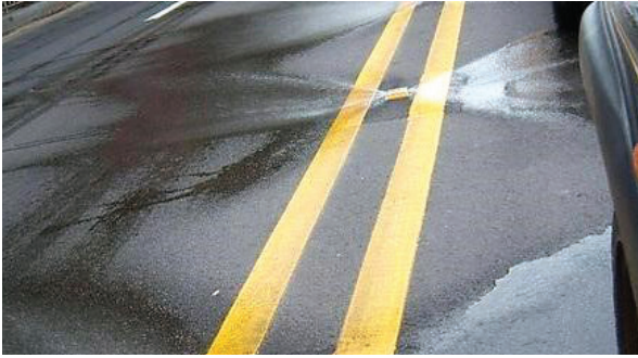
Автоматизирано чистење на улици